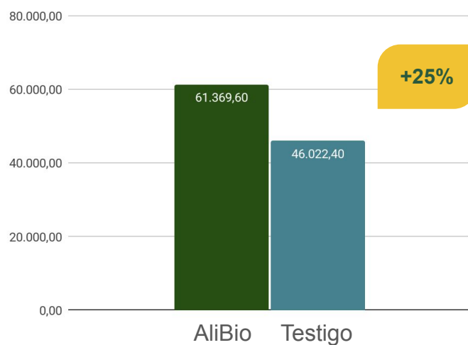
Plantas por superficie tratada (1.89 acres)